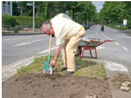
Was wir heute tun, entscheidet, wie die Welt morgen aussehen wird.

grauen Mauer, verwaiste Betonpflanzkübel auf öffentlichem Straßengrund, die nicht vorhandene Sitzbank vor dem eigenen Ladengeschäft, die blütenlose Verkehrsinsel gegenüber. Für jede Hand findet sich etwas. Und dann freut man sich, wenn aus dem Nichts ein frisch angepflanzter Rosenstock auftaucht, blühende Pflanzschalen unten an der Mundsburger Brücke stehen, ein älterer Herr inmitten einer Verkehrsinsel Blumen pflanzt.