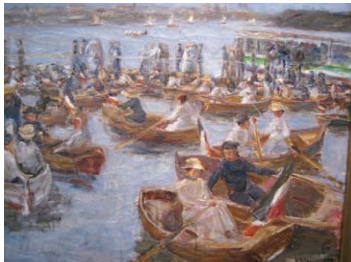
Max Liebermann - 1910 - Abend am Uhlenhorster Fährhaus

Das erste Fährhaus, um 1840 erbaut, verfügte lediglich über einen Aufenthaltsraum mit Getränkeausschank. Von 1845 an wurde es von einer Wagenfähre angelaufen. Und ab