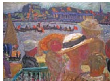
Pierre Bonnard - 1913 - Blick vom Uhlenhorster Fährhaus auf die Außenalster mit St. Johannis

Wenn Sie heute durch den kleinen ruhigen Park an dieser Stelle gehen, und Ihnen im kalten Winter 2009/2010 die Lust auf warmen Sommer kommen sollte, dann lassen Sie sich vereinnahmen von der Zeit der „Uhlenhorster Belle Epoque“, und besuchen Sie diese Ausstellung, es lohnt sich! Die ca. 80 Gemälde und zusätzliche Arbeiten auf