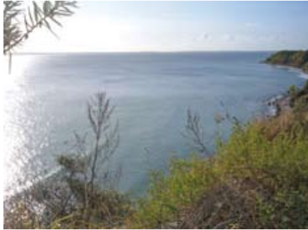
Blick von den Klippen