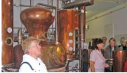
Besuch in der Edeldestillerie

Wieder auf Rügen ging es zur Besichtigung der Edeldestillerie und zur Schnapsprobe. Was sehr lustig war. Nachmittags – es war trocken – fuhren wir dann nach Schaprode. Dort gingen wir