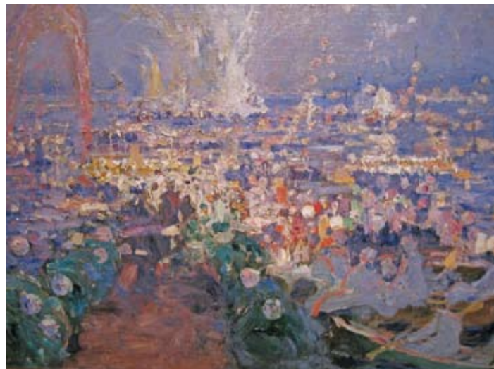
Hugo Vogel - 1910 - Feuerwerk am Uhlenhorster Fährhaus

repräsentatives Ausflugslokal mit großzügiger Terrassenanlage errichtet. Dieses zweite Uhlenhorster Fährhaus war ein markanter Bau mit einem Haupthaus nebst stattlichem Turmbau und einem von zwei kleineren Turmhauben gekröntem, zur Außenalster rund abschließenden Seitenflügel. Es besaß im