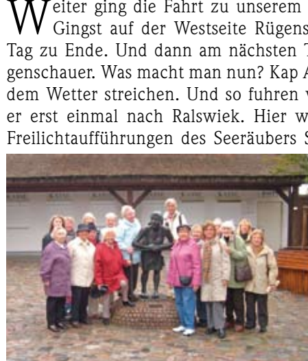
Vor dem Freilichttheater in Ralswiek

Weiter ging die Fahrt zu unserem Hotel „Rügen-Park“ in Gingst auf der Westseite Rügens. Es ging ein sonniger Tag zu Ende. Und dann am nächsten Tag: dicke Wolken, Regenschauer. Was macht man nun? Kap Arkona konnten wir bei dem Wetter streichen. Und so fuhren wir durch Regenschauer erst einmal nach Ralswiek. Hier werden im Sommer die Freilichtaufführungen des Seeräubers Störtebeker aufgeführt.